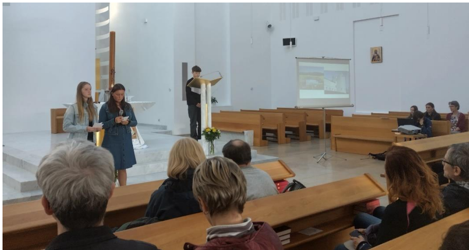
Noc kostelů 23. 5. 2025 organizovala farní mládež